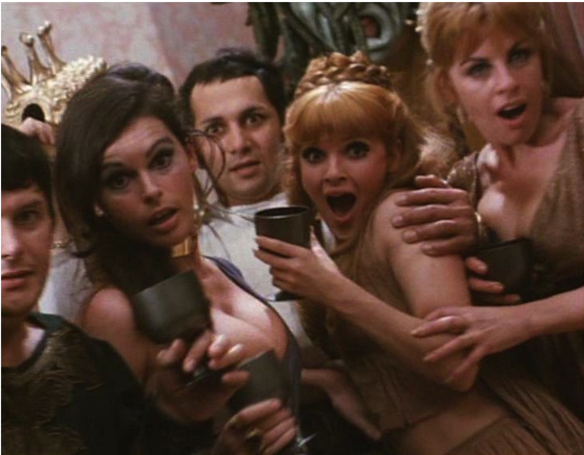
Up Pompeii : mais très vite effrayées.