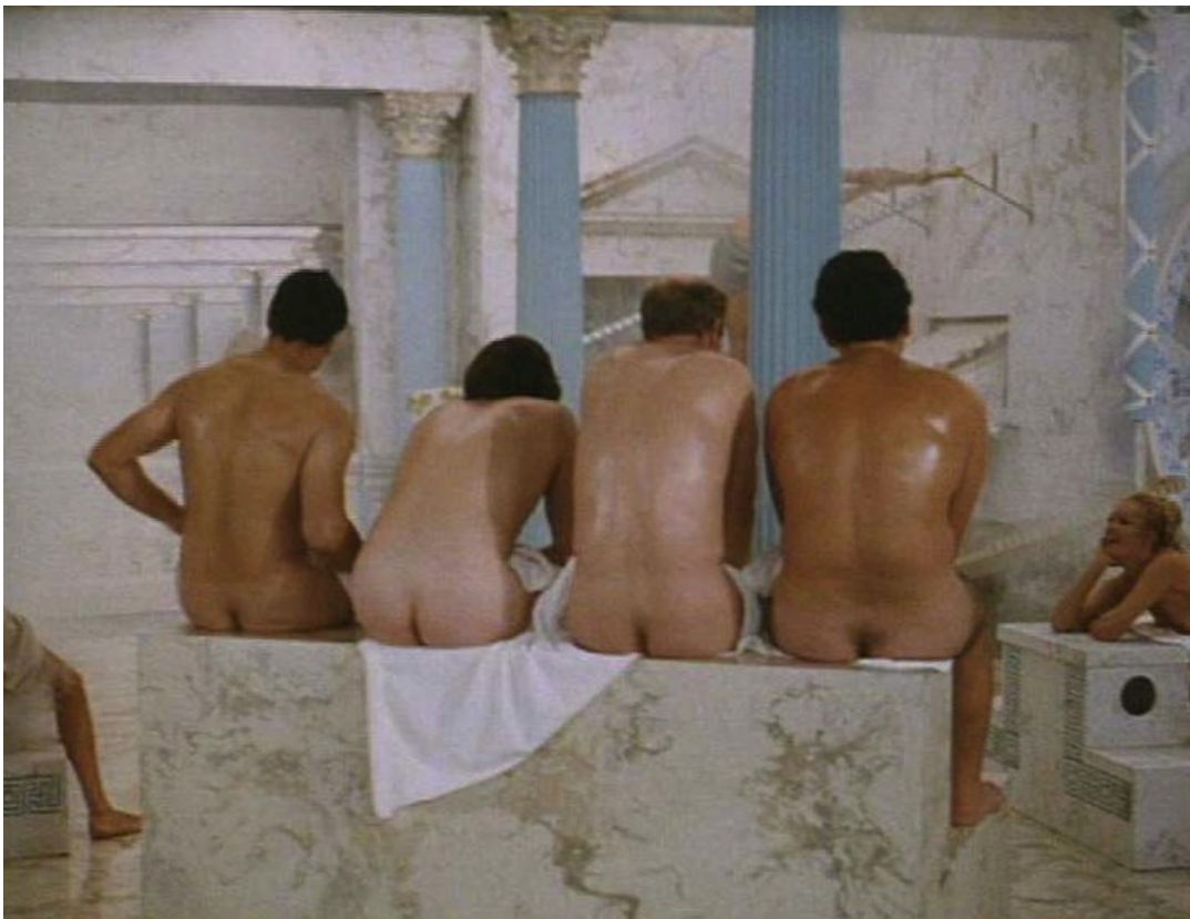
Up Pompeii : Tandis que des patriciens discutent aux thermes,