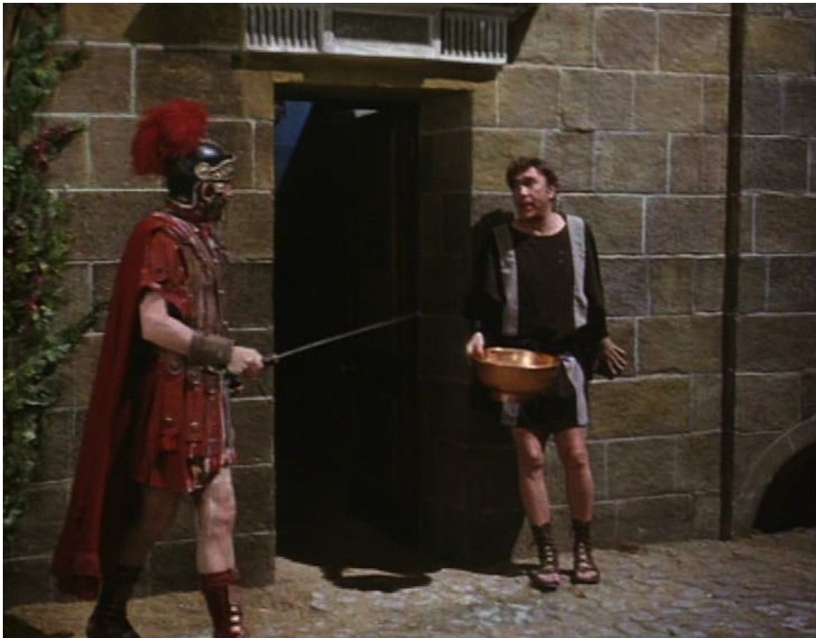
Up Pompeii : Lurcio et le centurion