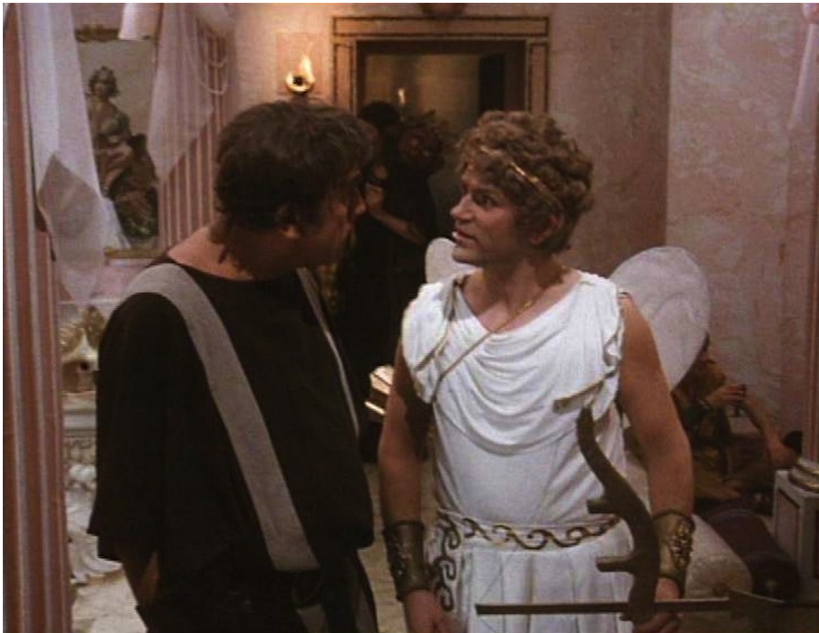
Up Pompeii : Lurcio et l'amoureux de la fille de Ludicrus Sextus