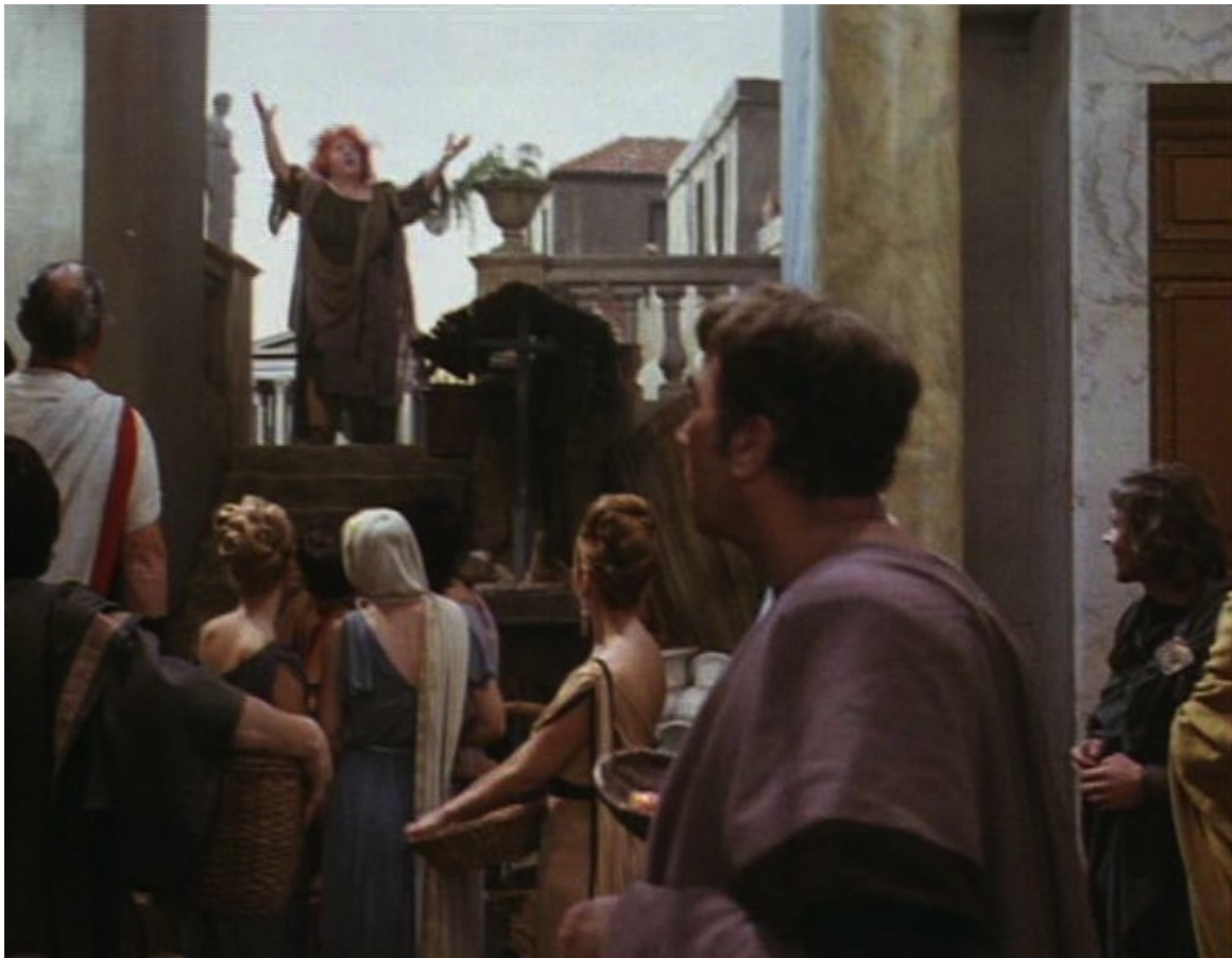
Up Pompeii : Cassandra, la prophétesse qui annonce la destruction de Pompéi