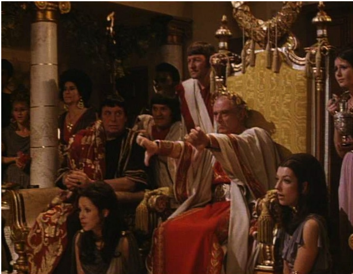
Up Pompeii : ... et Néron tourne les pouces vers le bas pour le faire exécuter ;