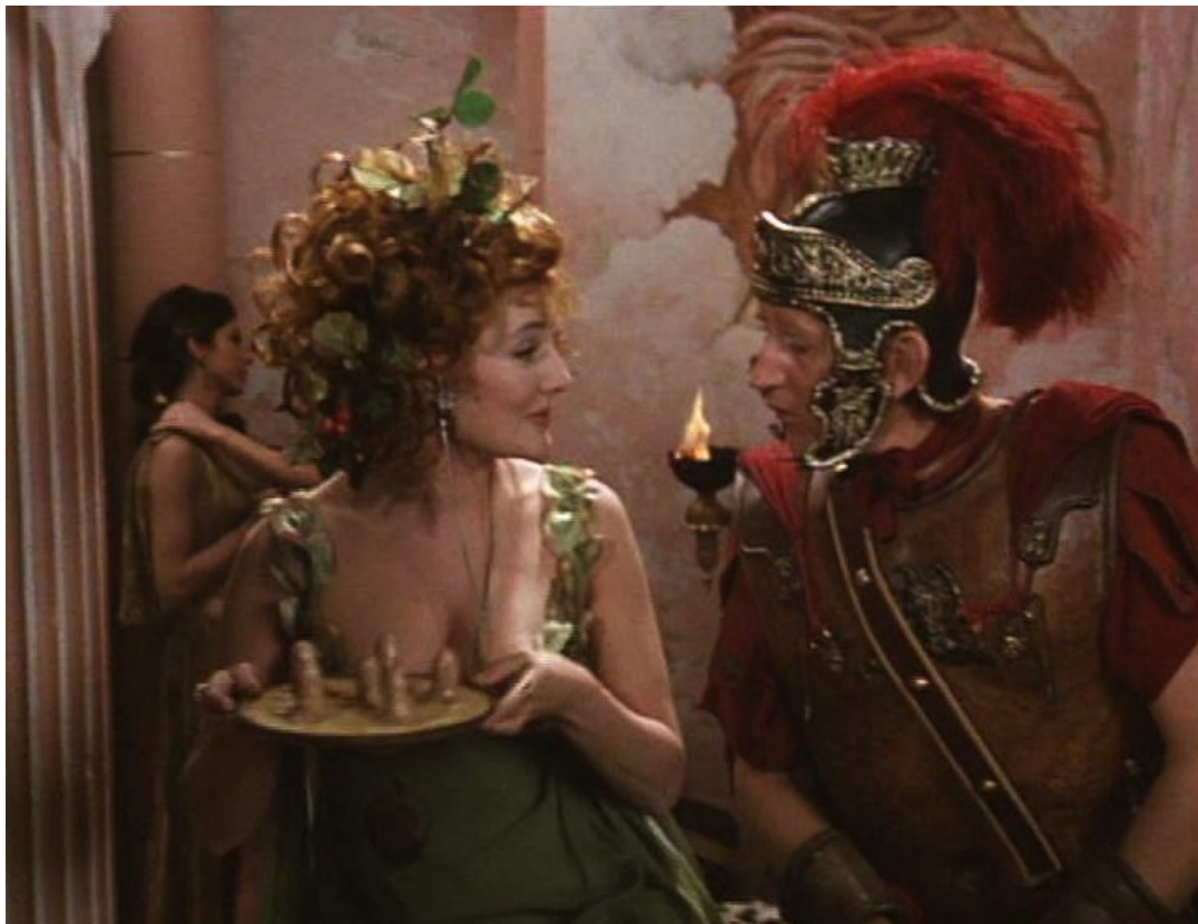
Up Pompeii : Ammonia accueille le centurion au début de l'orgie ;