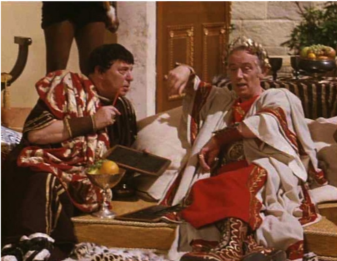
Up Pompeii : des discussions avec le comptable