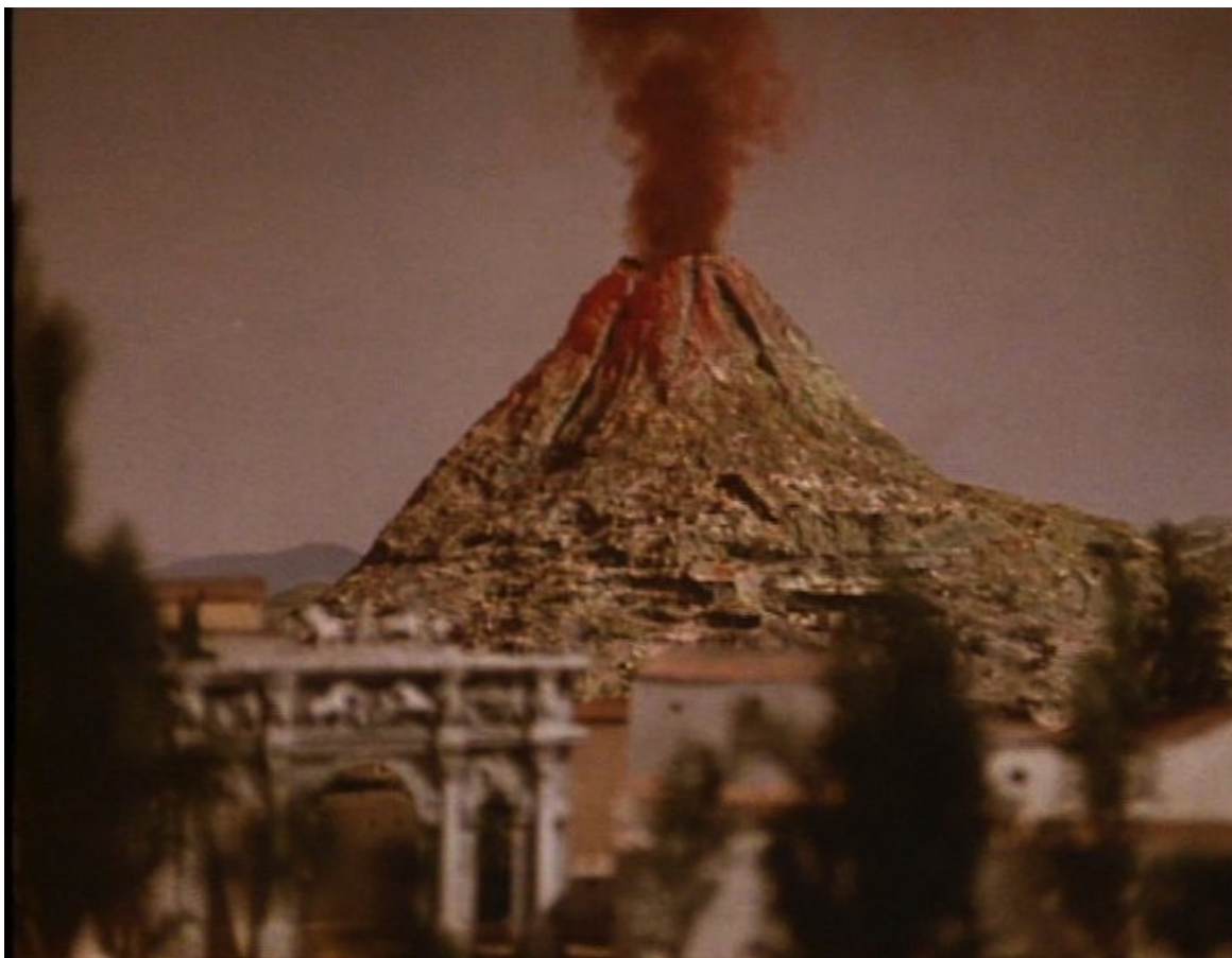
Up Pompeii : un volcan prêt à exploser,