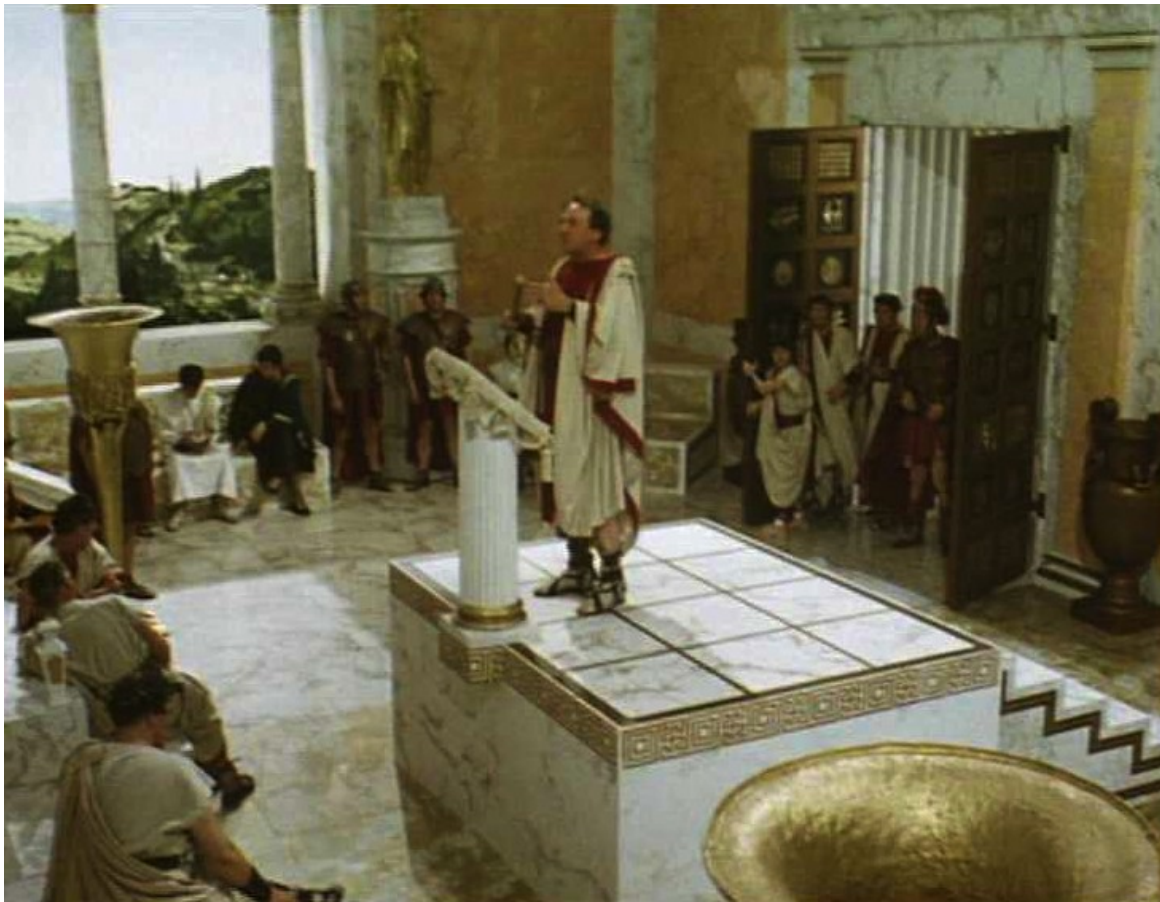
Up Pompeii : À Pompéi, on trouve aussi de sages réunions politiques,