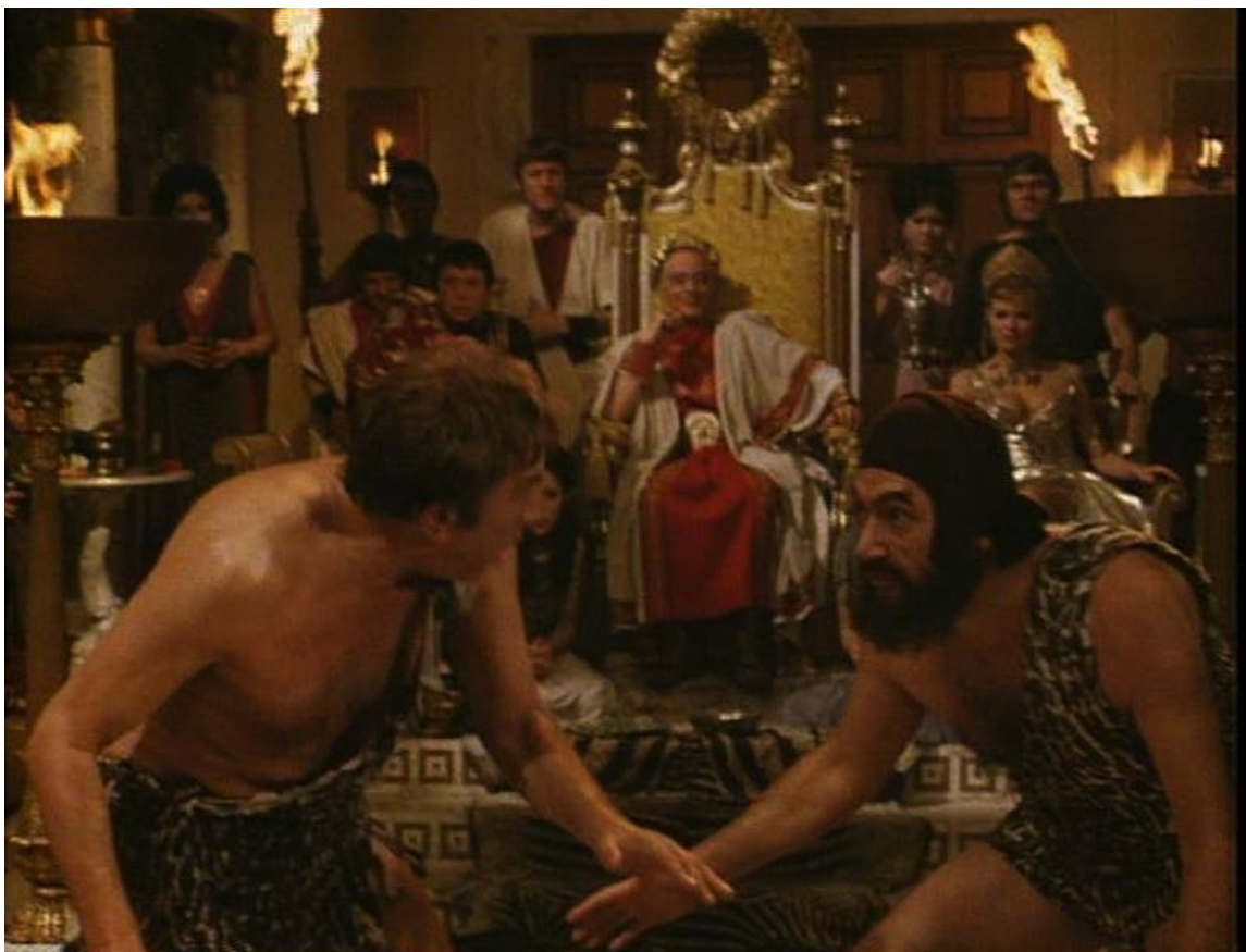
Up Pompeii : Lurcio et le lutteur Gorgo