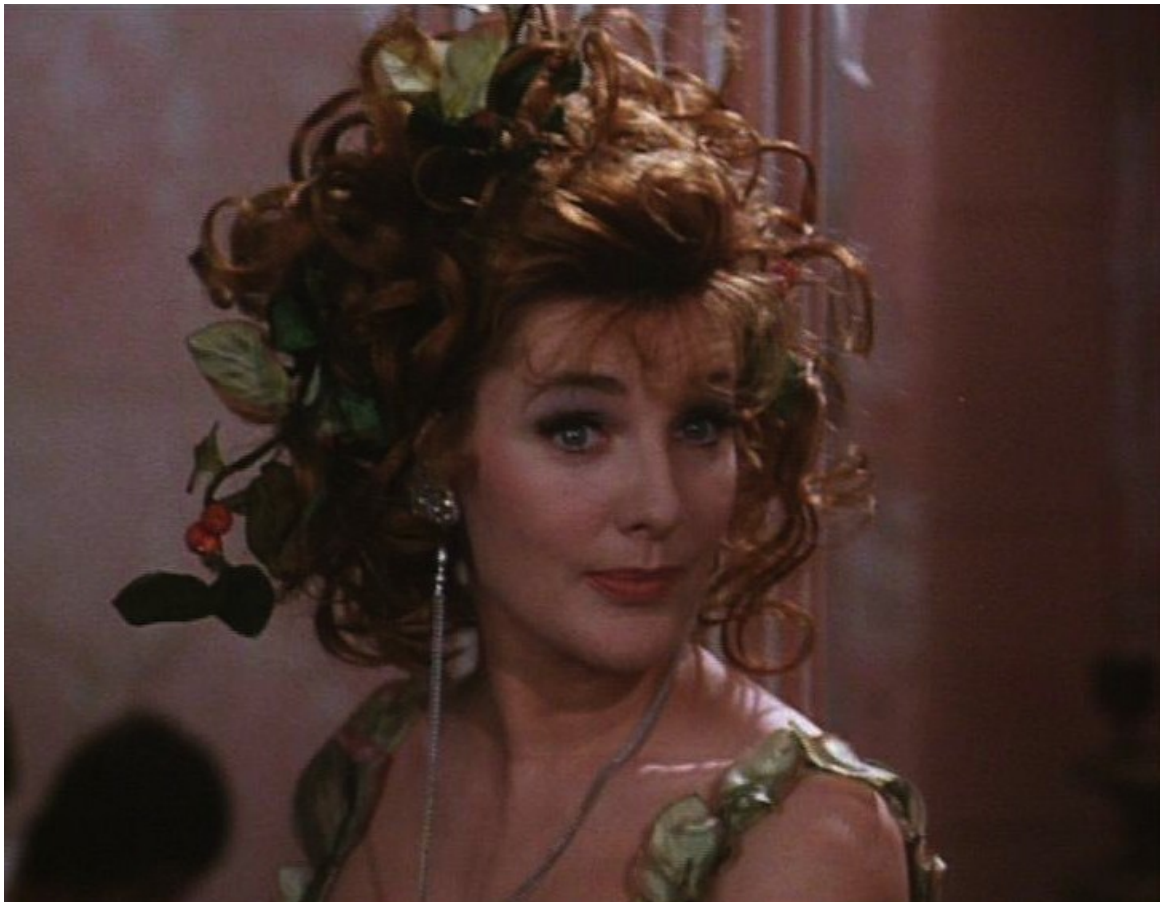
Up Pompeii : Ammonia, l'épouse de Ludicrus Sextus