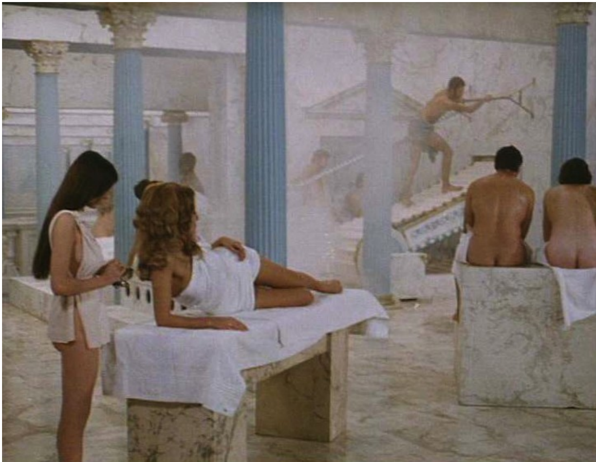
Up Pompeii : une baigneuse contemple le spectacle, puis se tourne vers son esthéticienne et...