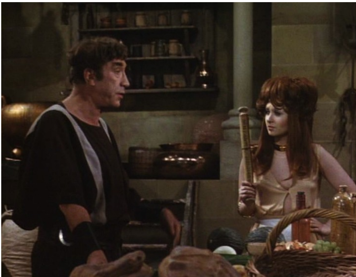
Up Pompeii : Lurcio transmet un rouleau de parchemin à la cuisinière Scrubba, naïve et décomplexée...