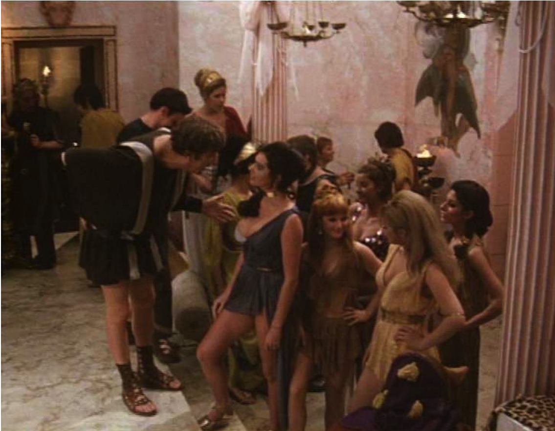
Up Pompeii : arrivent à l'orgie des filles jeunes, jolies et fort peu vêtues,