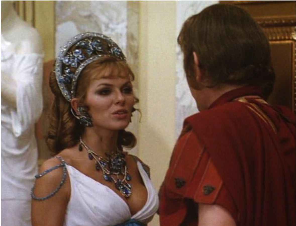
Up Pompeii : la belle Volupta, au nom prédestiné