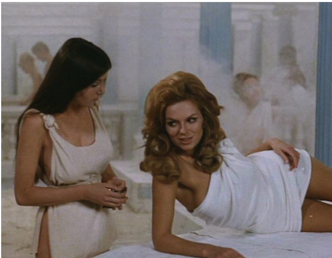
Up Pompeii : ... lui murmure : "Dans ce bain, tu vois toutes ces faces familières ?"