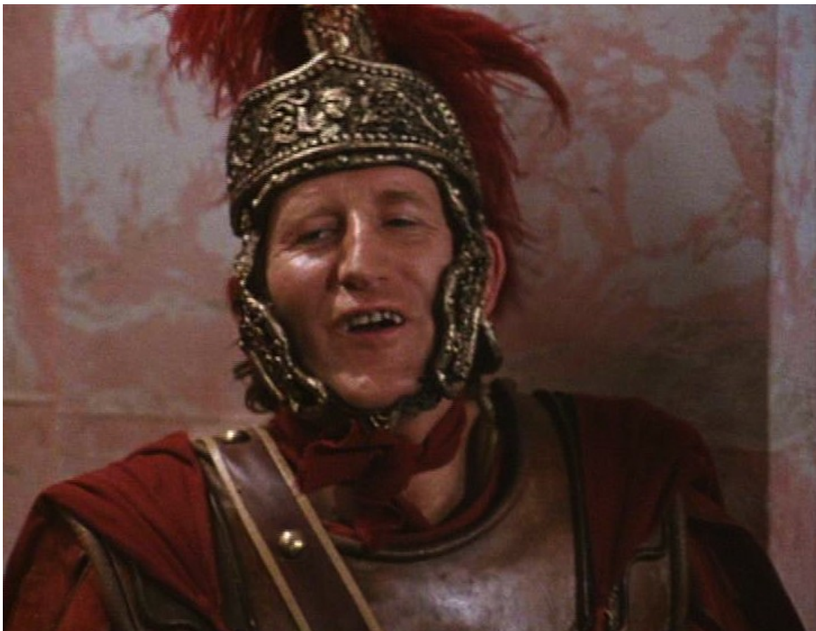
Up Pompeii : le centurion benêt