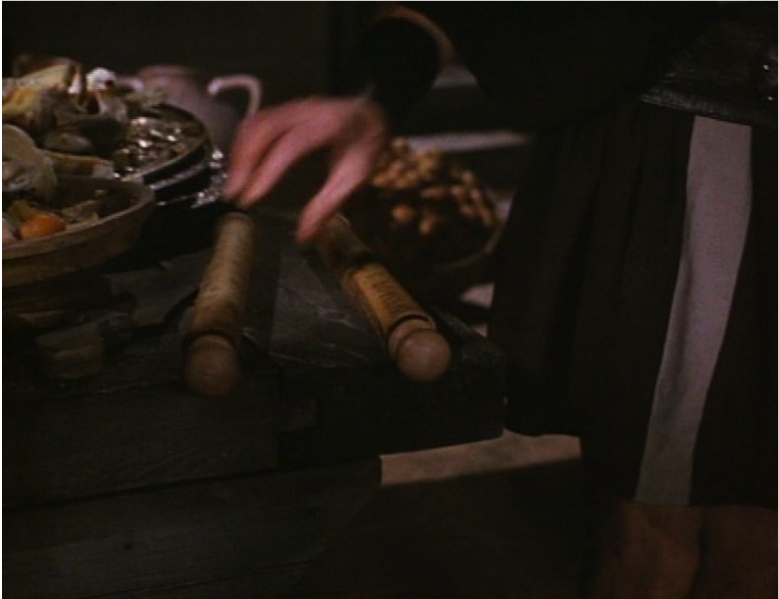
Up Pompeii : ... qui croit que les "volumina" ont un autre usage.