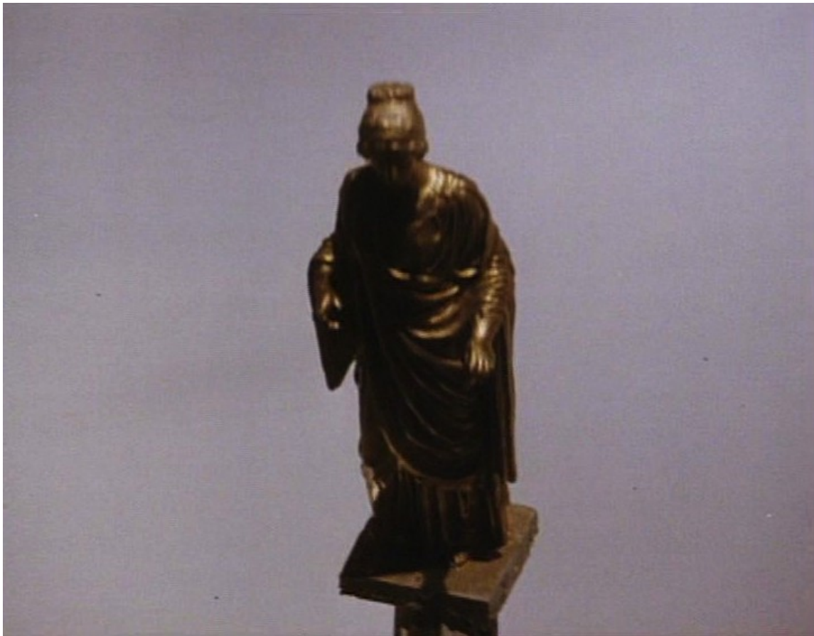
Up Pompeii : et Lurcio, en s'enfuyant, se fait presque écraser par une statue qui tombe.