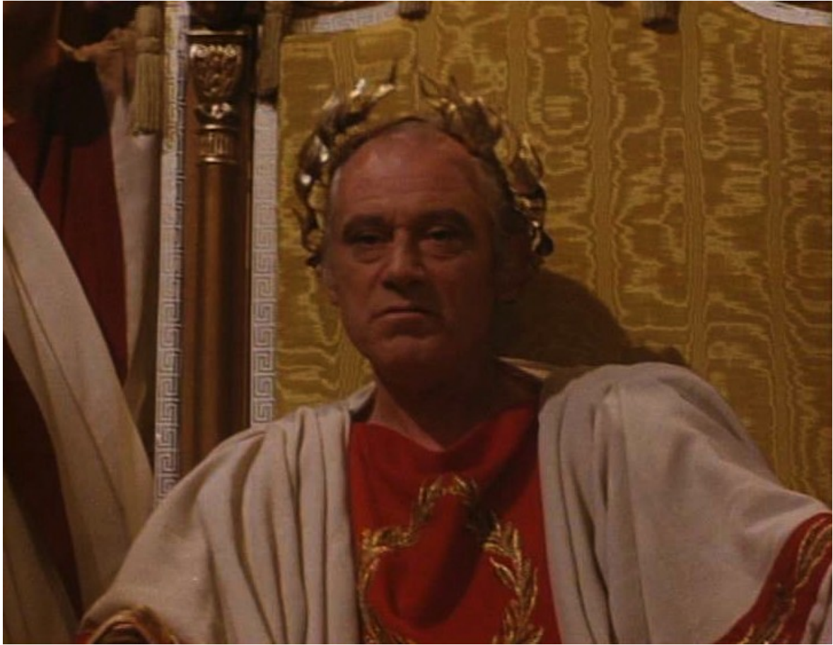
Up Pompeii : Néron