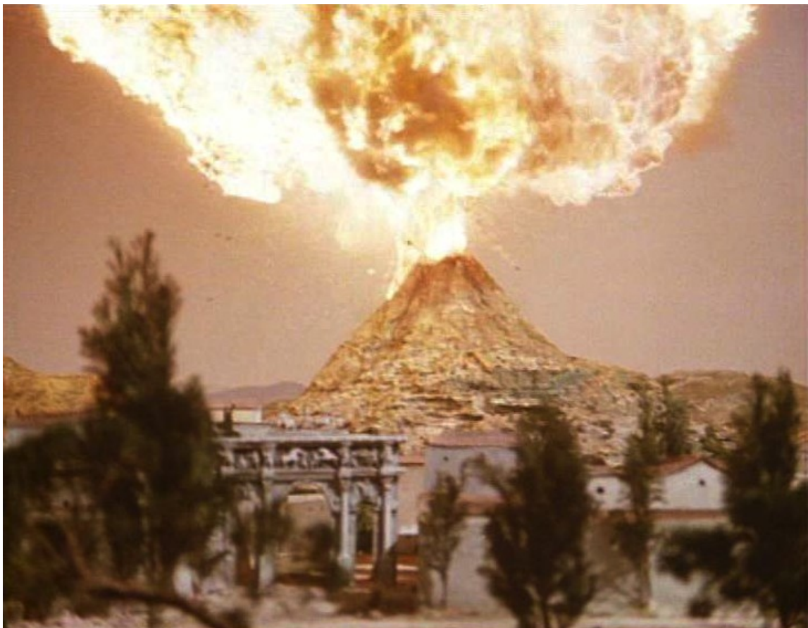
Up Pompeii : mais le Vésuve explose