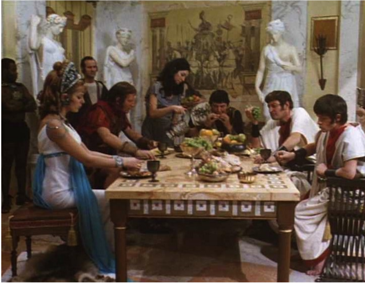
Up Pompeii : des repas de famille,