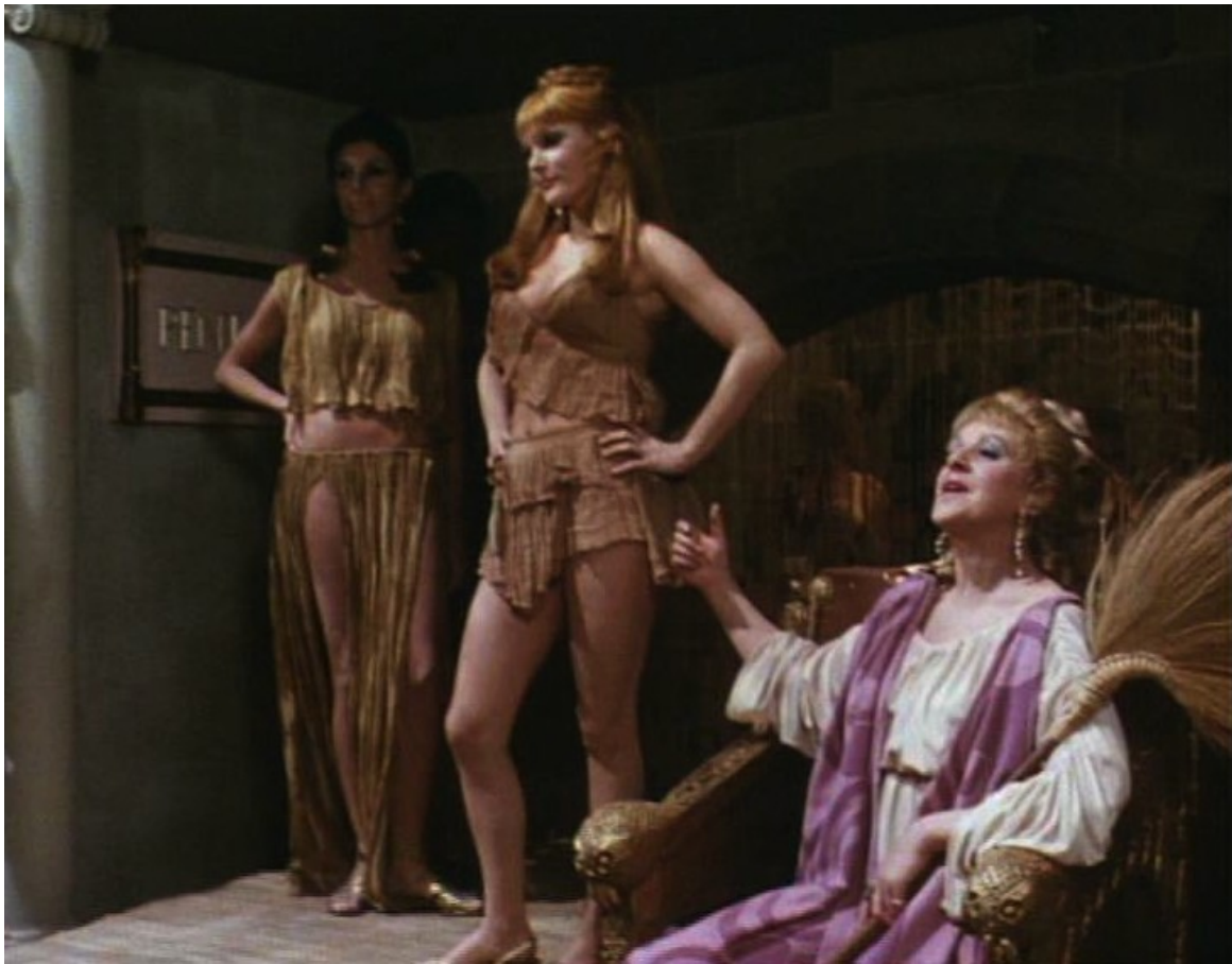
Up Pompeii : des entremetteuses qui vantent leur marchandise,