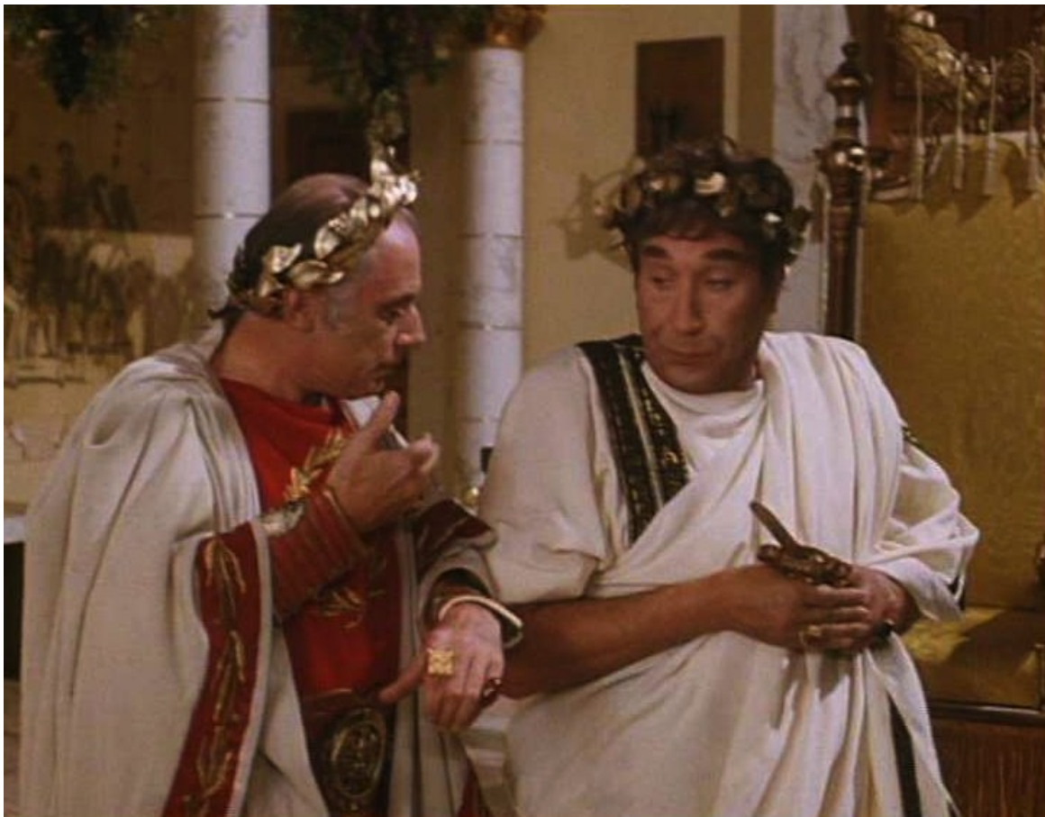
Up Pompeii : Lurcio et Néron