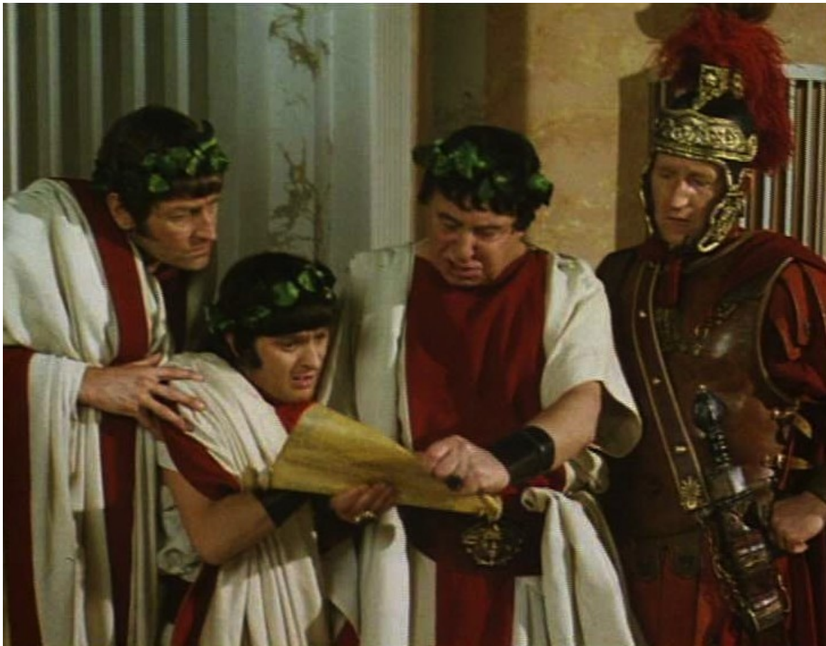
Up Pompeii : les conjurés tout aussi benêts