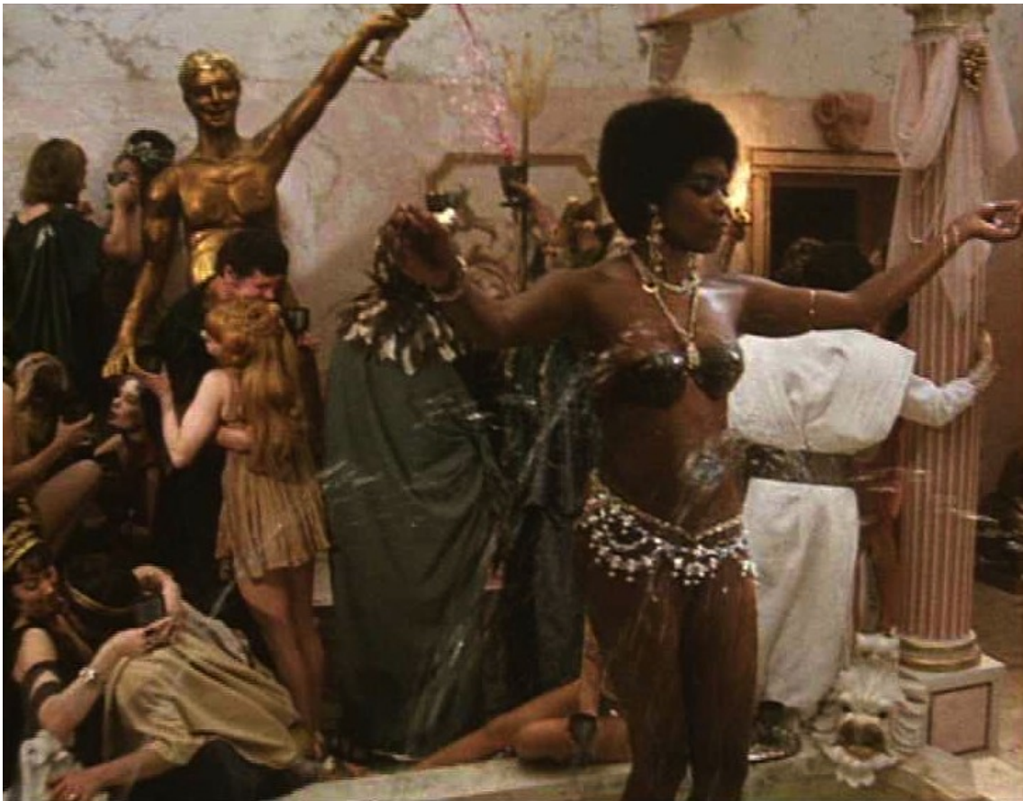
Up Pompeii : À l'orgie, on voit des danseuses en tenues affriolantes,