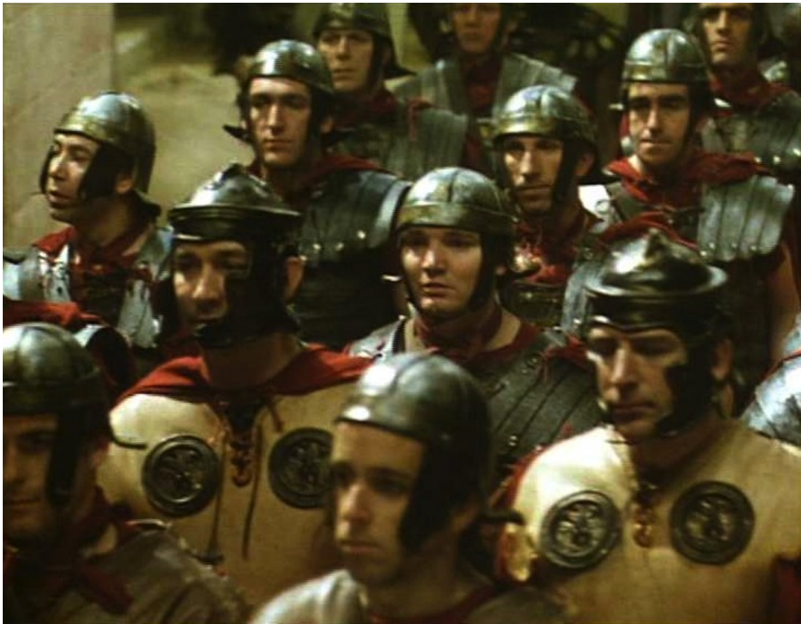
Up Pompeii : des défiles militaires,