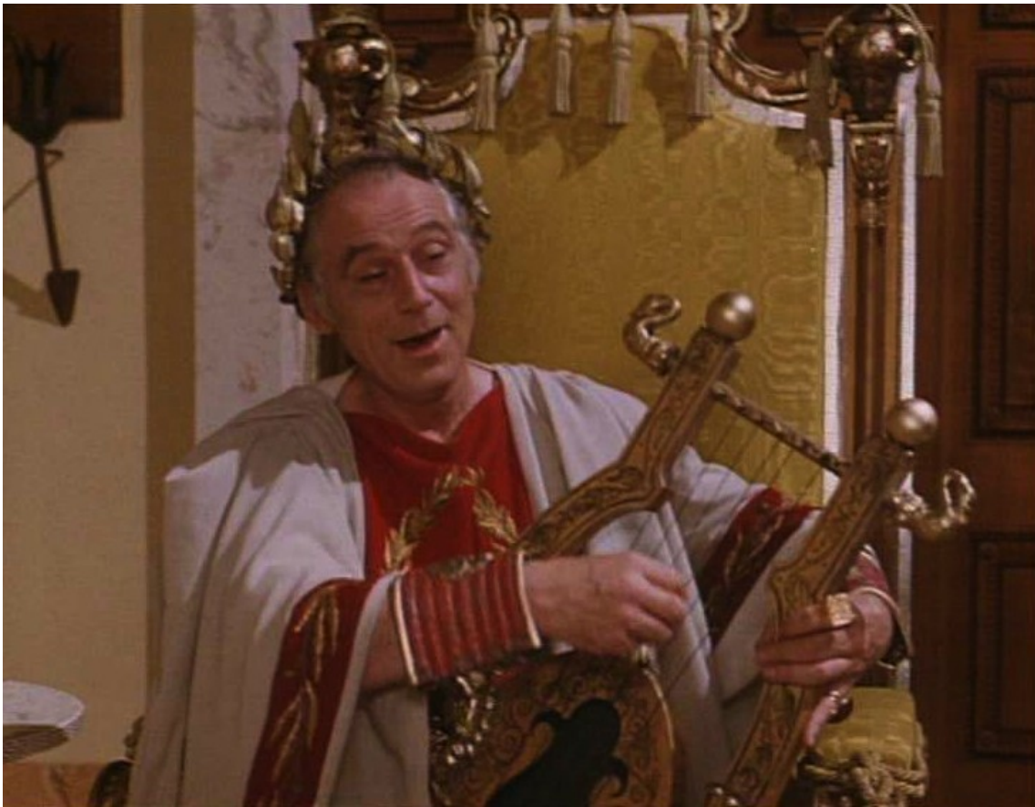
Up Pompeii : des musiciens (en l'occurrence Néron),