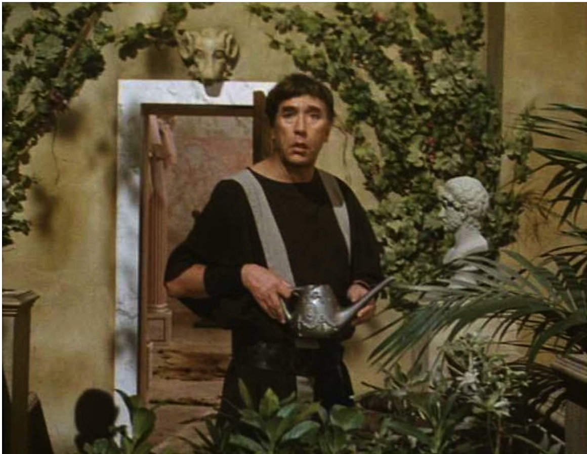
Up Pompeii : ... et déclare : "Qu'est-ce que vous pensez que je faisais ?"