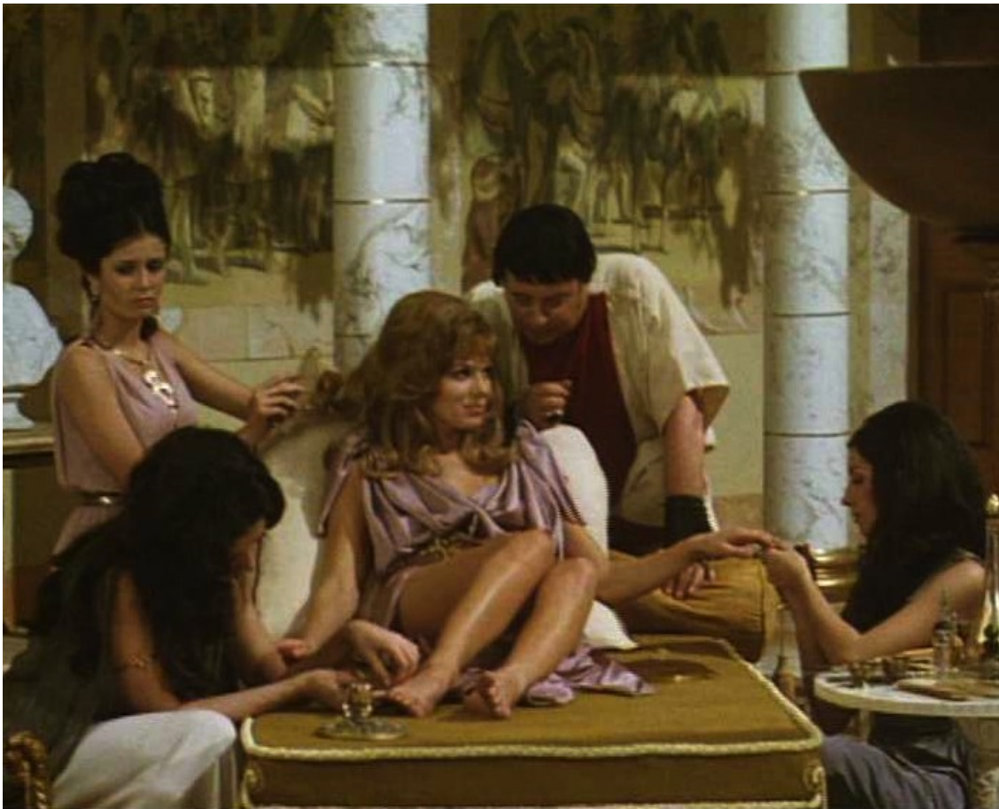
Up Pompeii : d'agréables séances de manucure et pédicure,