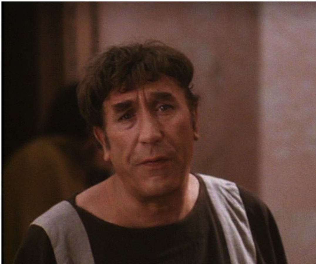
Up Pompeii : Mais Lurcio échappe à la mort et peut nous raconter ses malheurs.