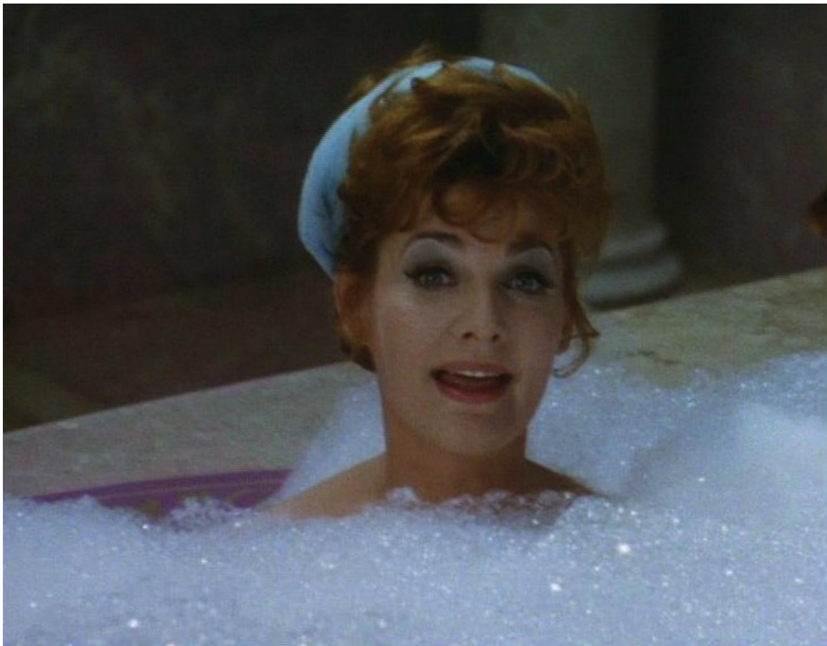
Up Pompeii : des bains agréables chez soi,