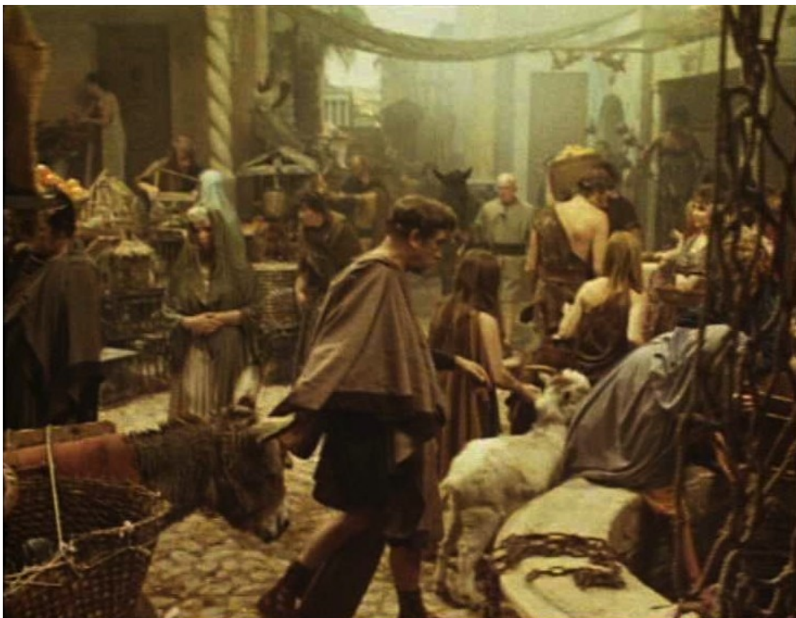
Up Pompeii : des rues animés,