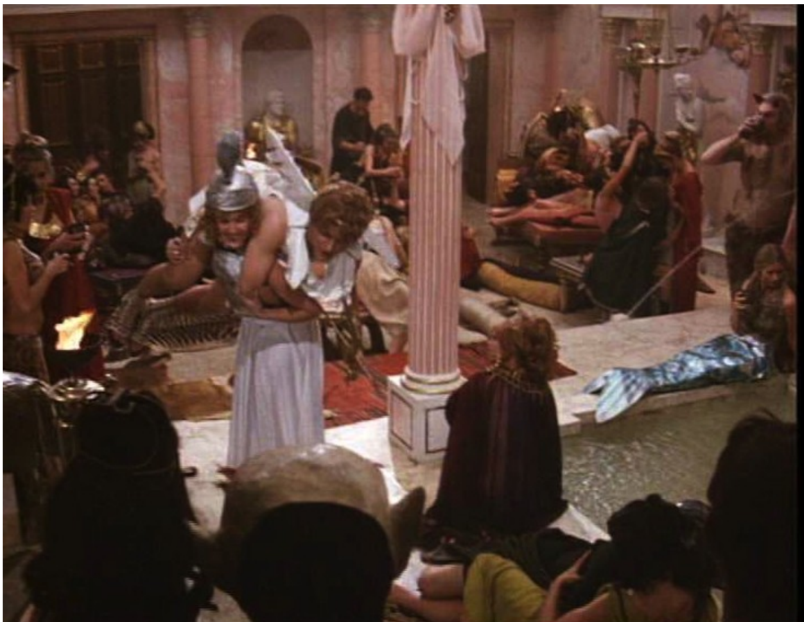
Up Pompeii : et une ambiance torride.