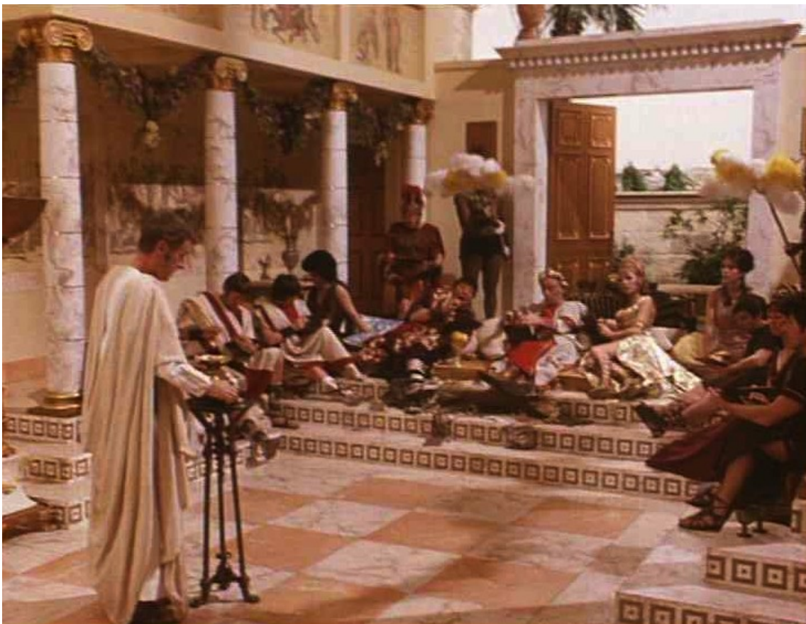
Up Pompeii : des réunions mondaines,