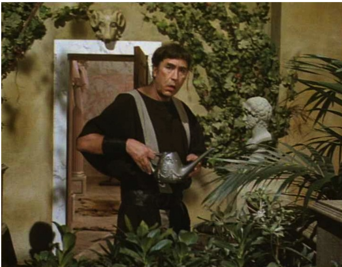
Up Pompeii : arrosoir, puis il se tourne vers les spectateurs...