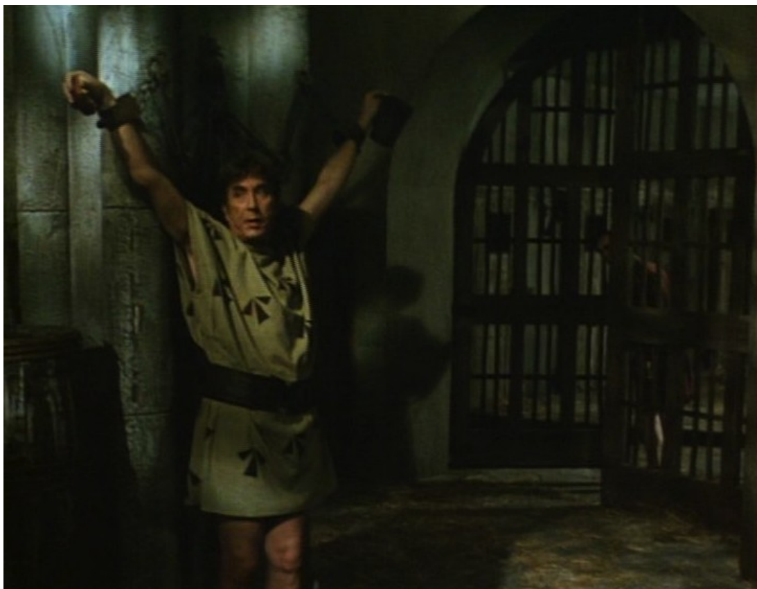
Up Pompeii : Lurcio est jeté en prison,