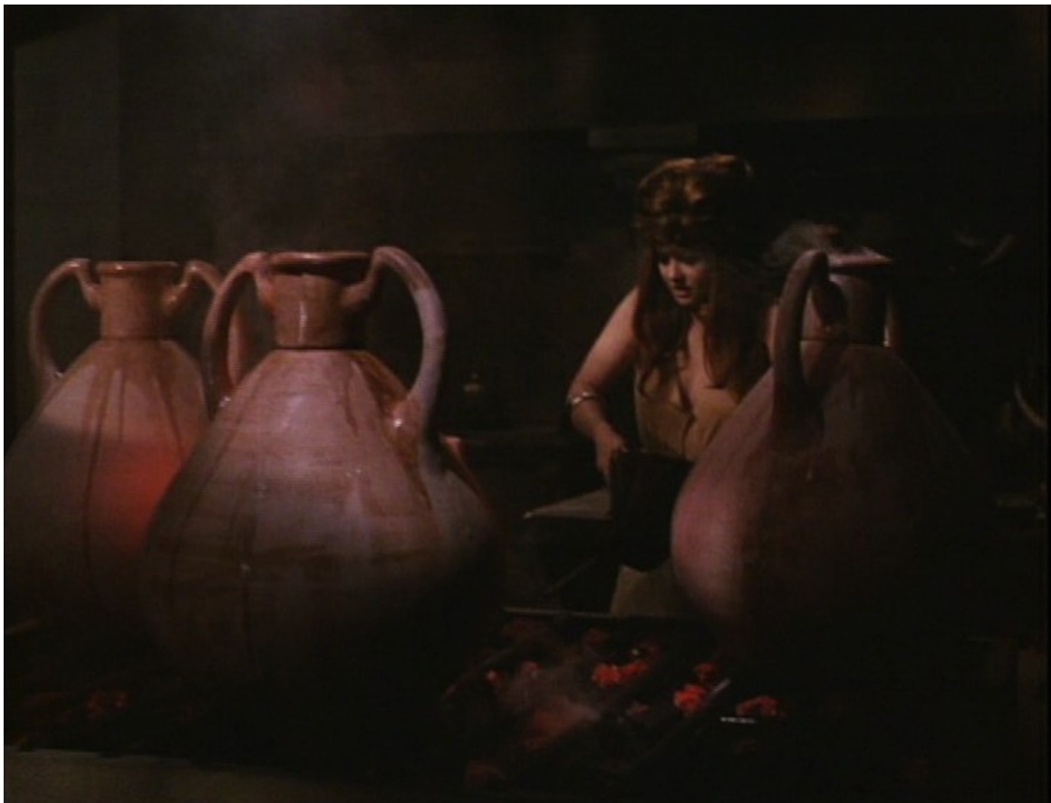
Up Pompeii : la naïve cuisinière Scrubba